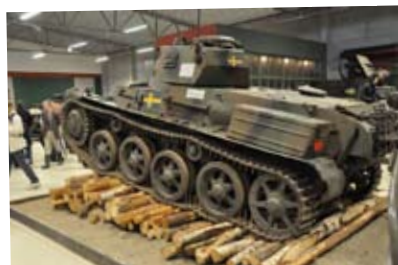
Försvarsfordonsmuseet Arsenalen i Strängnäs