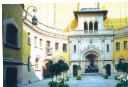
Hallwylska Museet med guidad visning