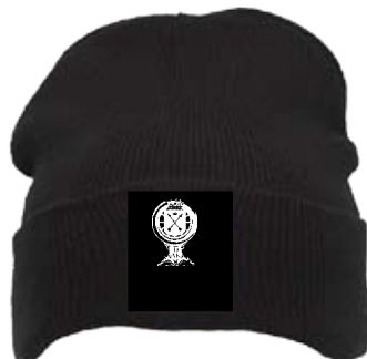
Svart toppluva med guldbrodyr